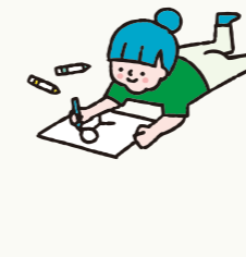
小学校6年生 保護者

私は文章を書くことが得意ではないので、フ リースクールを表すマスコットを描いてみまし た。継ぎはぎの理由は、「別々のものが1つのも のになっている感じを出したかった」からです。 いろいろな子がフリースクールを作っている様 子を表しました。