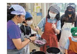
SAAB(国際交流フェスティバル)(11月)