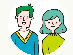
小学校6年生 保護者

小学2年から不登校の息子が友達と通う為、乗 れなかった電車で1人で乗れるようになり、堂々 と意見を言うようになりました。昔の息子よりも 心の強い息子になり驚いています。1年でここま で成長出来たのは、通い始めたタイミングの良 さ、そして友達と先生方への信頼があったから です。支えてくださりありがとうございました。